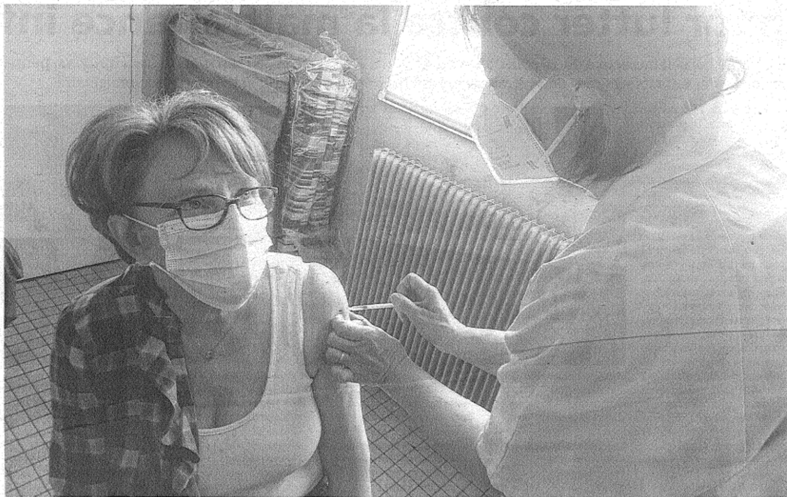
Jeudi matin, les aînés de Bois-Héroult sont venus recevoir leur deuxième dose de vaccin.

Argumenter a en effet été nécessaire, comme en témoigne cet extrait du courrier adressé à Pierre-André Durand, préfet de Seine-Maritime : « malgré nos efforts, nous rencontrons sur la commune de Bois-Héroult, commune rurale isolée sur le plan numérique (zone blanche), de graves difficultés à pouvoir organiser un rendez-vous, aux fins de vaccination contre la Covid 19, des personnes éligibles ». Et d'insister : « Nos administrés éligibles à la vaccination [...] sont privés de toute efficacité n'ayant aucune formation pour intervenir seuls sur la plateforme, d'autant plus qu'ils sont sans contact avec leurs enfants depuis plusieurs mois, du fait de la situation sanitaire en cours ».