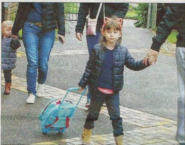
C'est l'heure de rentrer...