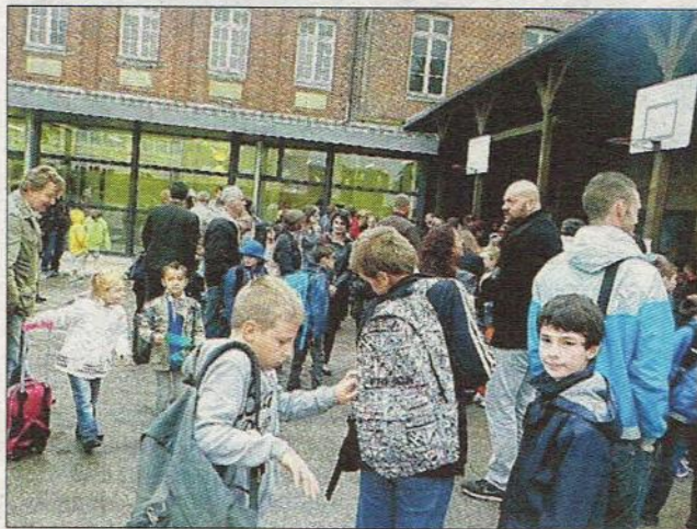
Les primaires réunis dans la cour