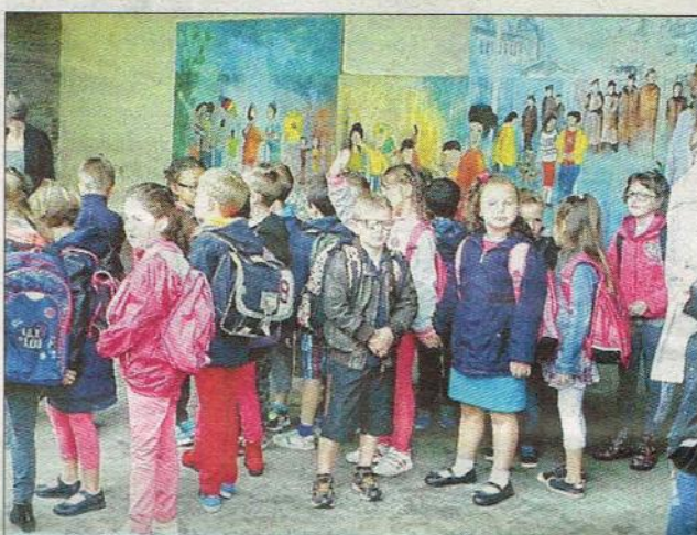
Il est bientôt l'heure d'entrer dans les classes.

Les petits écoliers ont repris le chemin de l'école mardi 1er septembre... Les enfants de maternelle se sont glissés dans leurs petits chaussons pour entrer en classe et les grands de primaire étaient fiers de se montrer les uns aux autres, leurs nouveaux cartables.