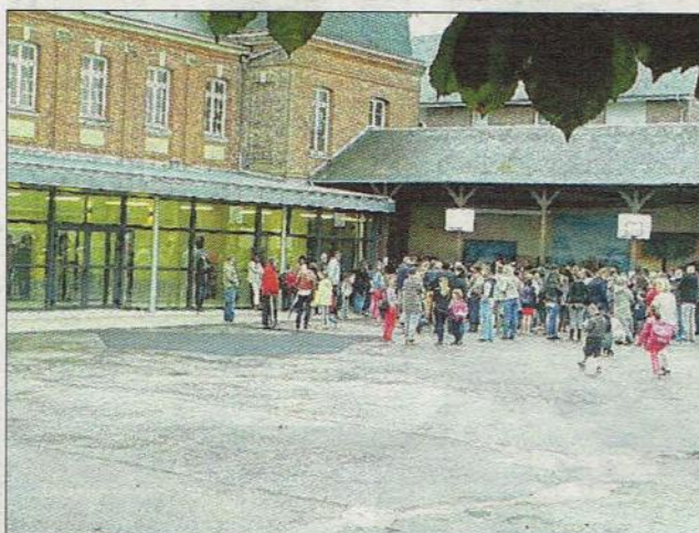
La nouvelle baie vitrée.